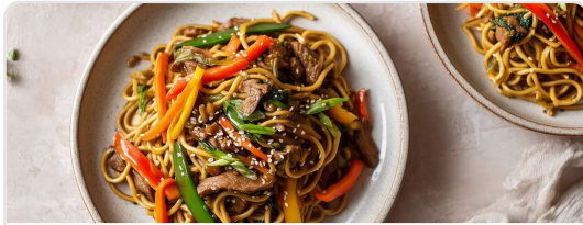
Cerdo con miel y soya, fideos chinos y verduras crujientes