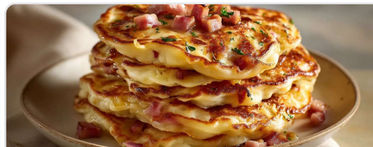
Pancakes salados de jamón y emmental