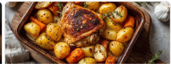
Muslo de pollo asado con papas y zanahorias