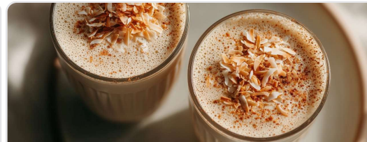
Smoothie proteico de yogur y coco