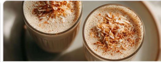
Smoothie proteico de yogur y coco