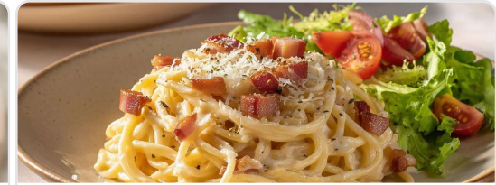
Pasta estilo carbonara ligera