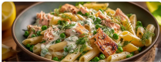
Pasta cremosa de salmón con chicharos