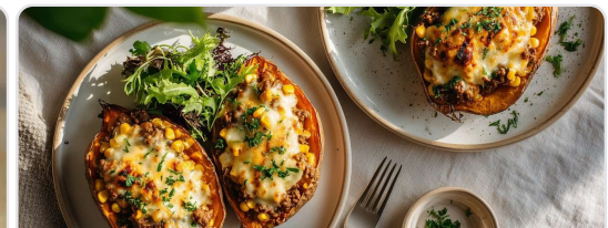
Camotes rellenos de carne y maíz gratinados