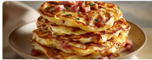
Pancakes salados de jamón y emmental