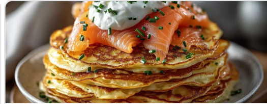
Pancakes salados con salmón ahumado