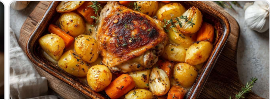
Muslo de pollo asado con papas y zanahorias