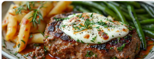
Bistec de carne molida con mozzarella, pasta y ejotes