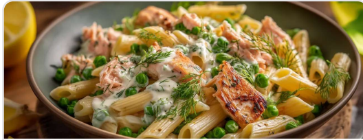
Pasta cremosa de salmón con chicharos