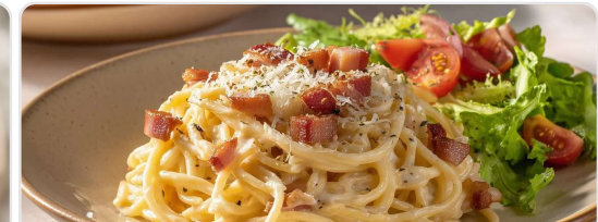
Pasta estilo carbonara ligera