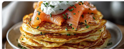
Pancakes salados con salmón ahumado