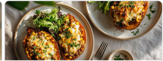
Camotes rellenos de carne y maíz gratinados