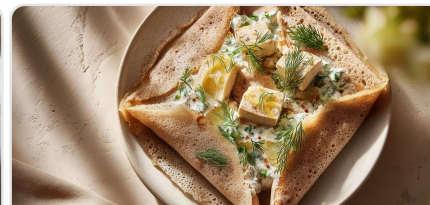
Galette de sarrasin au tofu fumé