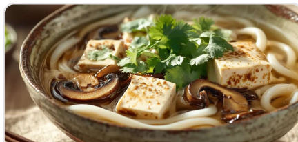
Soupe de nouilles udon au tofu soyeux