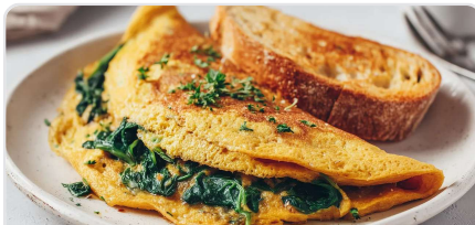
Omelette de pois chiches aux épinards