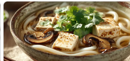
Soupe de nouilles udon au tofu soyeux