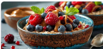
Porridge rapide aux fruits rouges