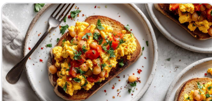
Tartine aux haricots blancs et tofu brouillé