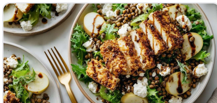
Salade festive de poires et lentilles avec tofu fumé