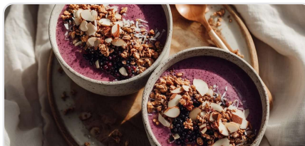
Smoothie bowl au tofu soyeux et aux fruits rouges