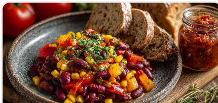
Sauté de haricots végétariens