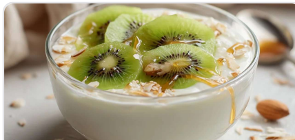
Yaourt végétal kiwi-amandes