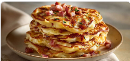
Pancakes salés au jambon végétal et à l'emmental végétal