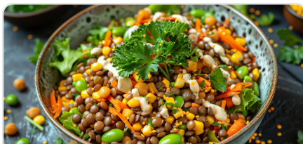
Salade de lentilles aux légumes