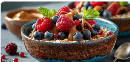
Porridge rapide aux fruits rouges