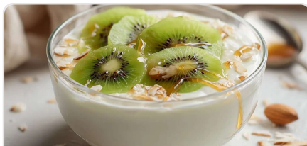
Yaourt végétal kiwi-amandes