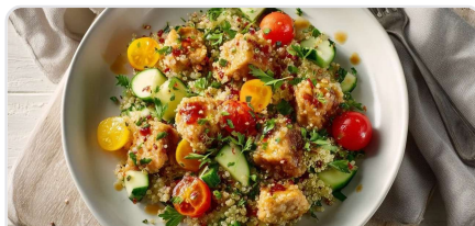
Salade d'été au quinoa et émincés végétaux