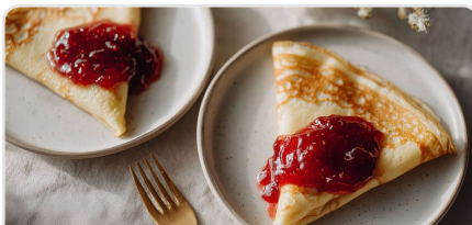
Crêpes protéinées à la confiture