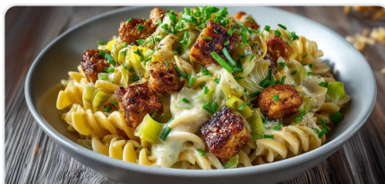
Pâtes au tempeh et poireaux