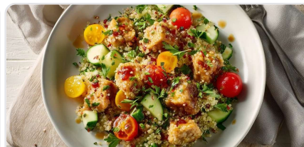
Salade d'été au quinoa et émincés végétaux