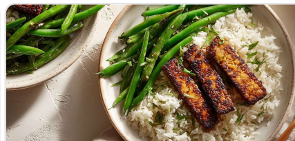
Riz coco aux émincés végétaux et haricots verts