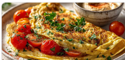
Omelette aux pois chiches avec houmous et tomates