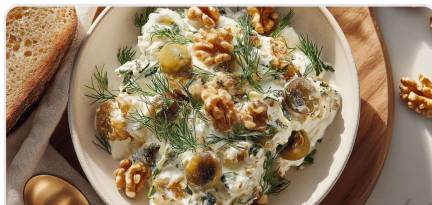
Skyr salé aux olives et aux noix