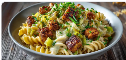
Pâtes au tempeh et poireaux