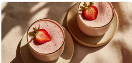
Smoothie protéiné fraise et banane