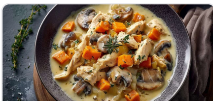
Blanquette aux émincés végétaux et aux patates douces