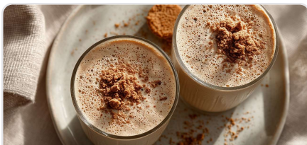
Smoothie protéiné au spéculoos