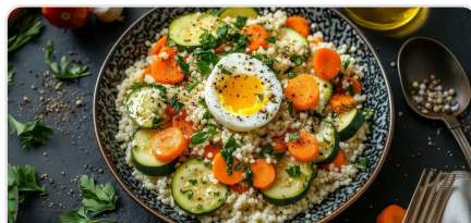
Couscous aux légumes et cumin avec œuf mollet