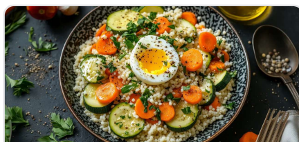
Couscous aux légumes et cumin avec œuf mollet