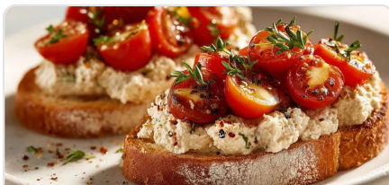
Toast aux rillettes de tofu et tomates