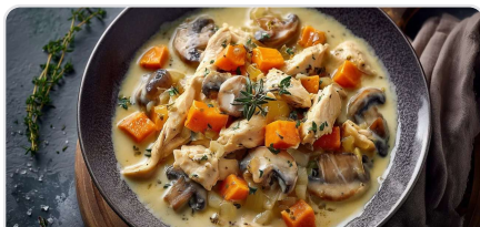
Blanquette aux émincés végétaux et aux patates douces