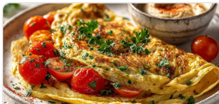
Omelette aux pois chiches avec houmous et tomates