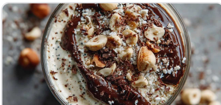
Yaourt végétal protéiné gourmand aux noisettes