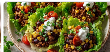
Wraps de laitue façon taco au bœuf haché sans lactose