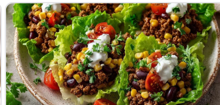
Wraps de laitue façon taco au bœuf haché sans lactose