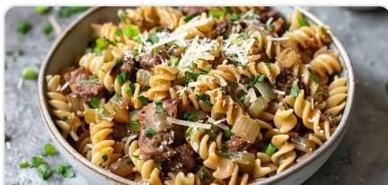
Pâtes au seitan et poireaux au gruyère