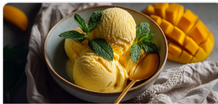
Glace protéinée fruitée au cottage cheese