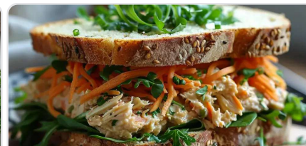
Sandwich au houmous et thon