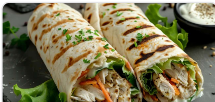
Wrap au poulet grillé et houmous