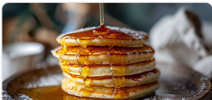
Pancakes protéinés à l'avoine