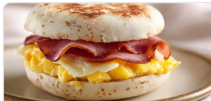
English muffin œuf-bacon