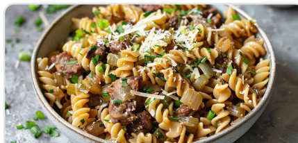
Pâtes au seitan et poireaux au gruyère