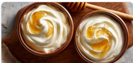
Fromage blanc et miel/agave