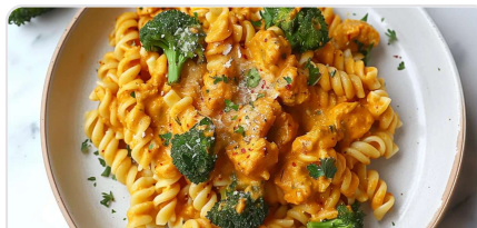
Pâtes crémeuses au curry avec steak haché