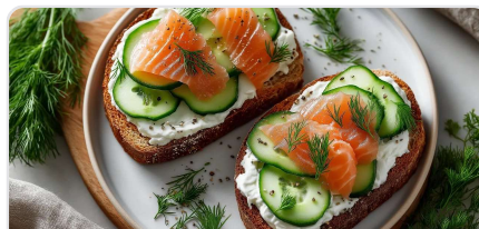
Toast au saumon fumé et yaourt végétal