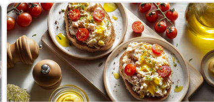
Toast aux rillettes de thon et tomates